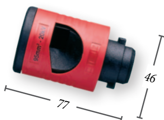
Đầu tước cho cáp - AV63...