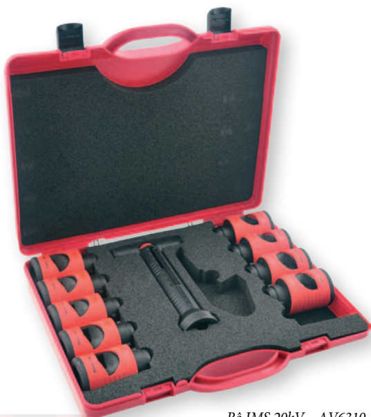
Bộ IMS 20kV - AV6310